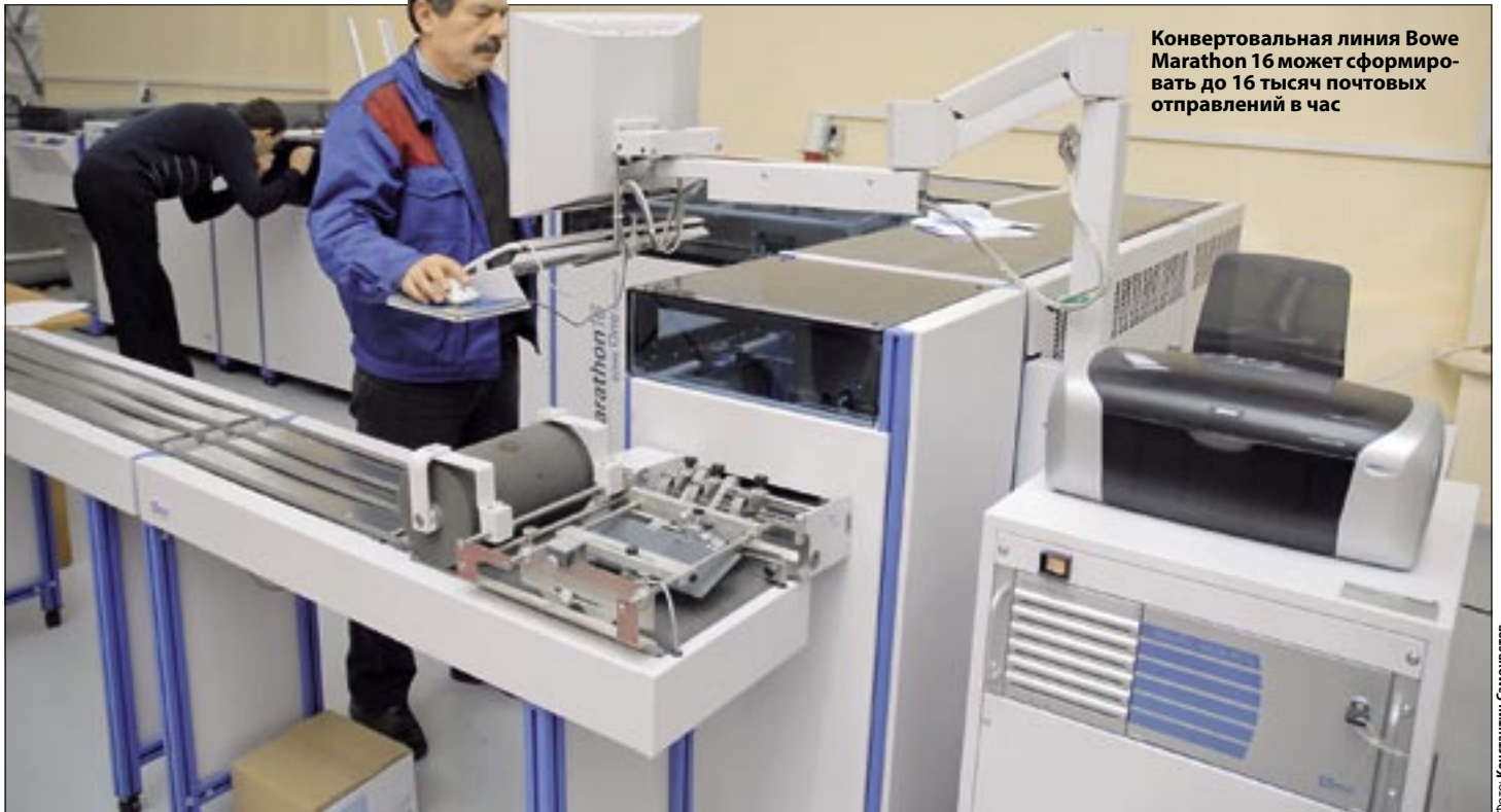
Конвертовальная линия Bowe Marathon 16 может сформировать до 16 тысяч почтовых отправлений в час