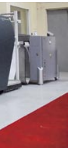
Общие инвестиции в оборудование составили более 2 млн долл.